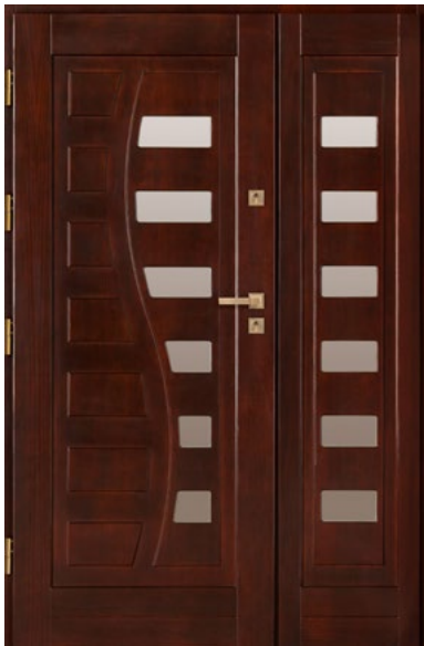
DZ9 z naświetlem bocznym